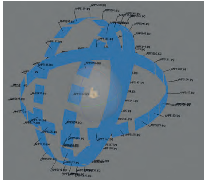
La figura muestra el esquema de fotografías tomadas para construir el modelo 3D: un total de 73 fotos desde diferentes puntos de vista.

de acuerdo un perfil de color específico para la sesión fotográfica. Las fotografías se fusionan posteriormente mediante una aplicación informática, generándose una nube de puntos con coordenadas en tres dimensiones. Esta nube se usa para construir una malla de triángulos sobre la que, finalmente, se superpone el color a partir de las fotografías iniciales. El modelo así construido puede tener artefactos o fallos que deben ser eliminados o corregidos: pueden quedar pequeños huecos sin datos que se rellenan manual o automáticamente.