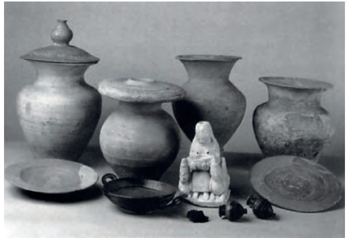
Piezas del ajuar funerario recuperadas del expolio de la tumba 20 de Tútuqi, entre ellas la Dama de Galera (Almagro-Gorbea 2009).

doble corona real egipcia. La cabeza femenina se encuentra hueca en su parte superior. Desde ahí se vertería el líquido que discurriría hacia los pechos horadados que, a su vez, verterían en el cuenco que la imagen sostiene entre sus manos. Esta ceremonia de carácter sagrado y ritual facilitaría que hubiera pasado de generación en generación hasta su depósito en la tumba 20, doscientos años después. La pieza está actualmente en el MAN por la donación de la colección Siret en 1928.