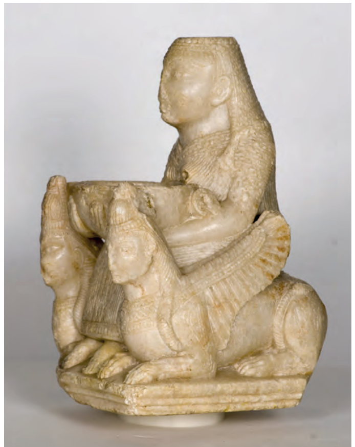
La Dama de Galera.